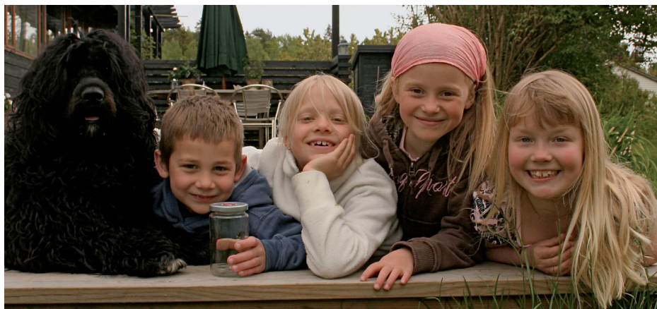
Venner for livet en vårdag i mai

Og du vil etter hvert få dine egne vaner og finne ut hva som er lurt for deg.